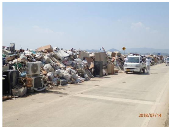
写真3 平成30年7月豪雨 片付けごみ排出状況（倉敷市）