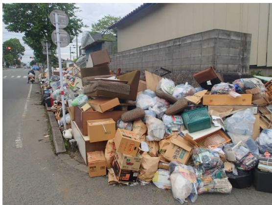
写真2 平成28年熊本地震 片付けごみ排出状況