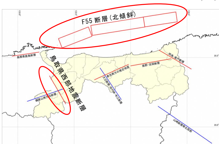
図2 想定する地震の断層位置図