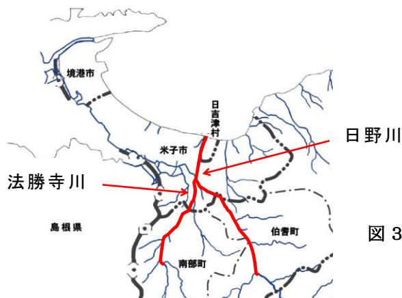
図3 想定する水害の河川位置図