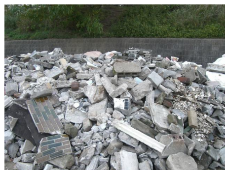
写真1 鳥取中部地震により発生した災害廃棄物の例